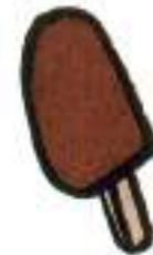
helado de chocolate